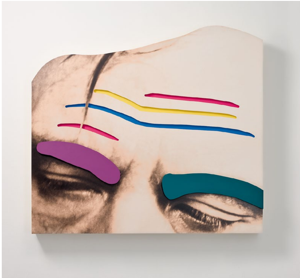
JOHN BALDESSARI, RAISED EYEBROWS / FURROWED FOREHEADS: (VIOLET AND GREEN EYEBROWS), 2008, three-dimensional archival print, laminated with Lexan, mounted on Sintra, acrylic paint, 57 3 / 4 x 63 3 / 4 x 6 3 / 4 " / HOCHGEZOGENE AUGENBRAUEN / GERUNZELTE STIRNEN, dreidimensionaler alterungsbeständiger Print, laminiert mit Lexan, aufgezogen auf Sintra, Acrylfarbe, 146,7 x 162 x 17,1 cm.

sem Freund, mit dem ich früher zur Schule ging, altes Reklametafelmaterial bekam. Ich dachte, es könnte interessant sein, mit alten Restmaterialien zu arbeiten.