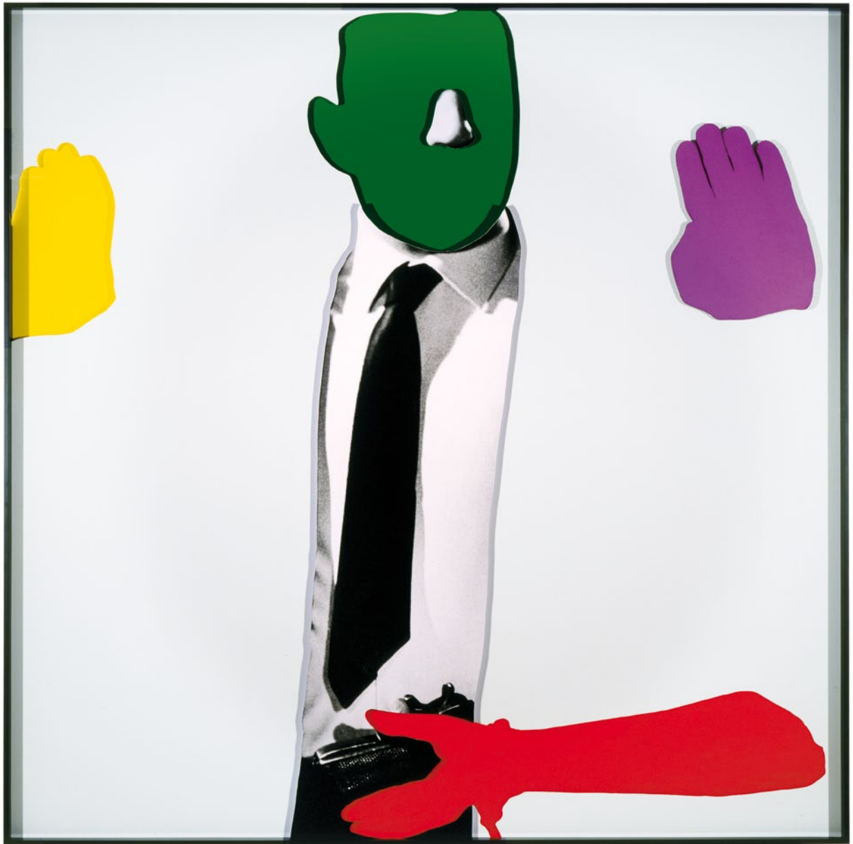
JOHN BALDESSARI, NOSES & EARS, ETC. (PART TWO): (GREEN) FACE WITH NOSE, (YELLOW AND VIOLET) HANDS, (RED) ARM AND PISTOL (WITH TIE), 2006, three-dimensional archival digital photographic prints, with acrylic paint, 72 x 71 1/2 x 4" / NASEN & OHREN, ETC. (TEIL ZWEI): (GRÜN) GESICHT MIT NASE, (GELB UND VIOLETT) HÄNDE, (ROT) ARM UND PISTOLE (MIT KRAWATTE), dreidimensionale alterungsbeständige photographische Prints, Acrylfarbe, 182,9 x 181,6 x 10 cm.