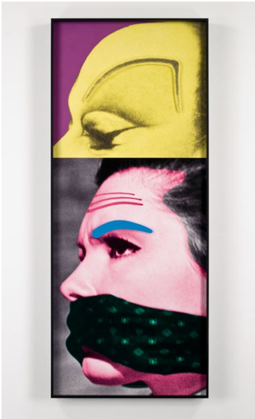
JOHN BALDESSARI, RAISED EYEBROWS / FURROWED FOREHEADS: PERSON GAGGED, 2009, three-dimensional archival print, laminated with Lexan, mounted on Sintra, acrylic paint, 84 x 34 3/4" / HOCHGEZOGENE AUGENBRAUEN / GERUNZELTE STIRNEN: FIGUR GEKNEBELT, dreidimensionaler alterungsbeständiger Print, lami- niert mit Lexan, aufgezoogen auf Sintra, Acrylfarbe, 213,3 x 88,2 cm.

begegnet. Beidseits davon sind Wandleuchten angebracht, die aussehen wie umgekehrte Nasen, und in den Nasenlöchern stecken künstliche Blumen. Nicht gerade das klassische Mies-Design, oder?