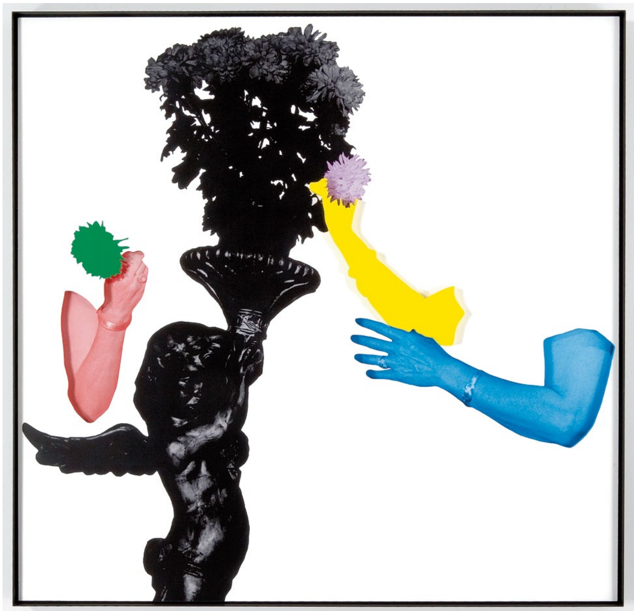
JOHN BALDESSARI, ARMS & LEGS (SPECIF. ELBOWS & KNEES), ETC.: THREE ARMS (TWO WITH FLOWERS) AND STATUARY, 2007, three-dimensional archival print, laminated with Lexan, mounted on Sintra, acrylic paint, 59 3 / 4 x 61 1 / 2 " / ARME & BEINE (BES. ELLBOGEN & KNIE), ETC.: DREI ARME (ZWEI MIT BLUMEN) UND SKULPTUR, dreidimensionaler alterungsbeständiger Print, laminiert mit Lexan, aufgezogen auf Sintra, Acrylfarbe, 151,7 x 156,2 cm.