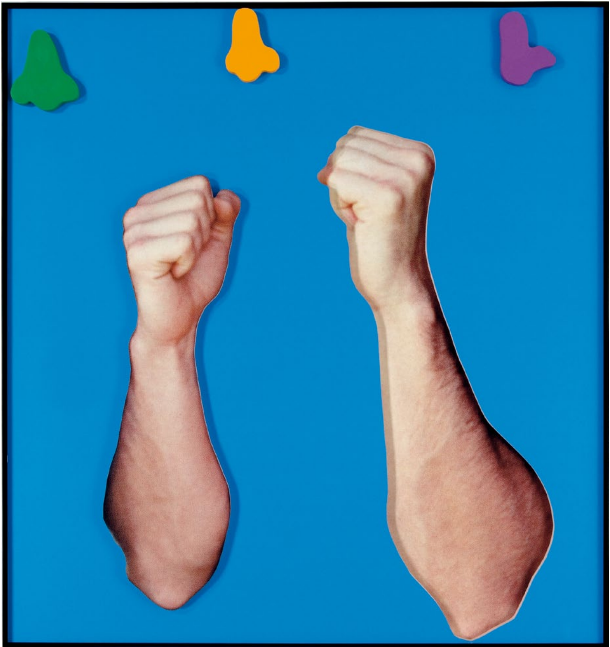
JOHN BALDESSARI, ARMS & LEGS (SPECIF. ELBOWS & KNEES), ETC.: TWO ARMS (WITH THREE NOSES), 2007, three-dimensional archival print, laminated with Lexan, mounted on Sintra, acrylic paint, 53 1/2 x 59 3/4" / ARME & BEINE (BES. ELLBOGEN & KNIE), ETC.: ZWEI ARME (MIT DREI NASEN), dreidimensionaler alterungsbeständiger Print, laminiert mit Lexan, aufgezogen auf Sintra, Acrylfarbe, 135,9 x 151,7 cm.