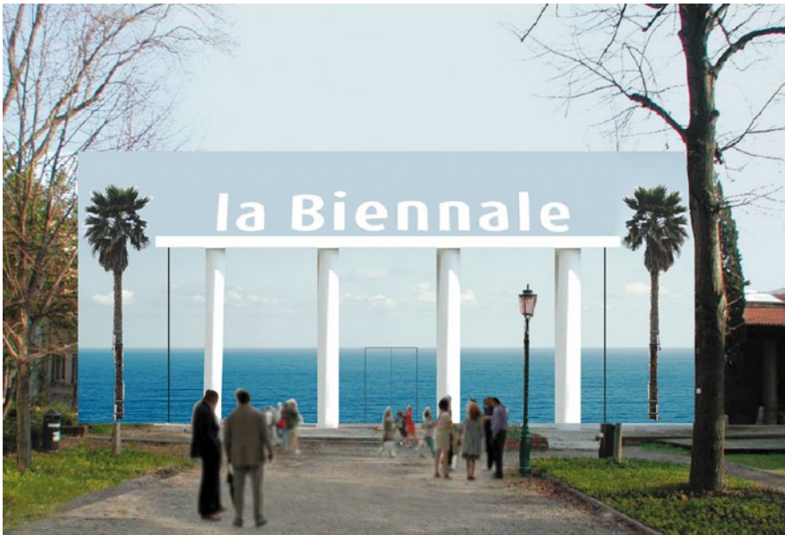
JOHN BALDESSARI, OCEAN AND SKY (WITH TWO PALM TREES), 2009, International Building Façade, Giardini, Venice Biennale, solvent based inkjet print on acrylic based adhesive vinyl, approx. 40 x 102' / OZEAN UND HIMMEL (MIT ZWEI PALMEN), lösemittelhaltiger Inkjet-Print auf acrylhaltiger Vinylklebefolie, ca. 12 x 31 m.

Dünen bei Oceano für einen Film eine römische Stadt gebaut und danach einfach zugeschüttet.